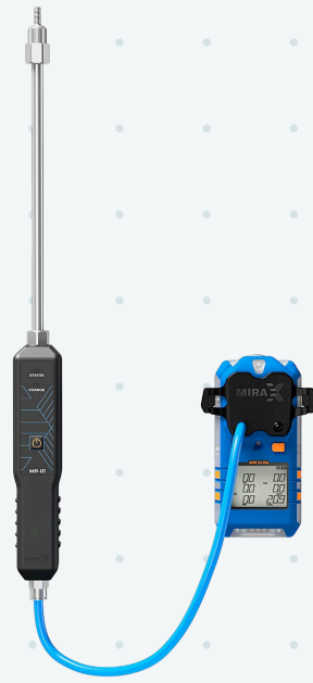
Моторизированный насос для отбора проб